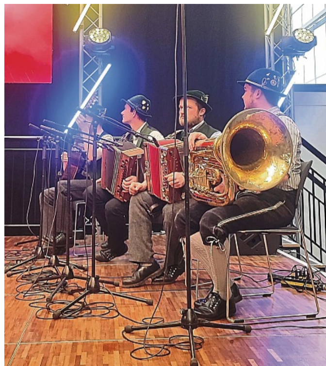
Musiker aus Lenggries spielten für die Besucher der Reisesmesse in Stuttgart auf.