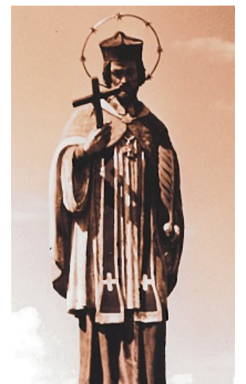
Der alte hölzerne Nepomuk ist jetzt im Heimatmuseum.

Heute verweilt er auf einem seidenen grün-goldenen Pro-