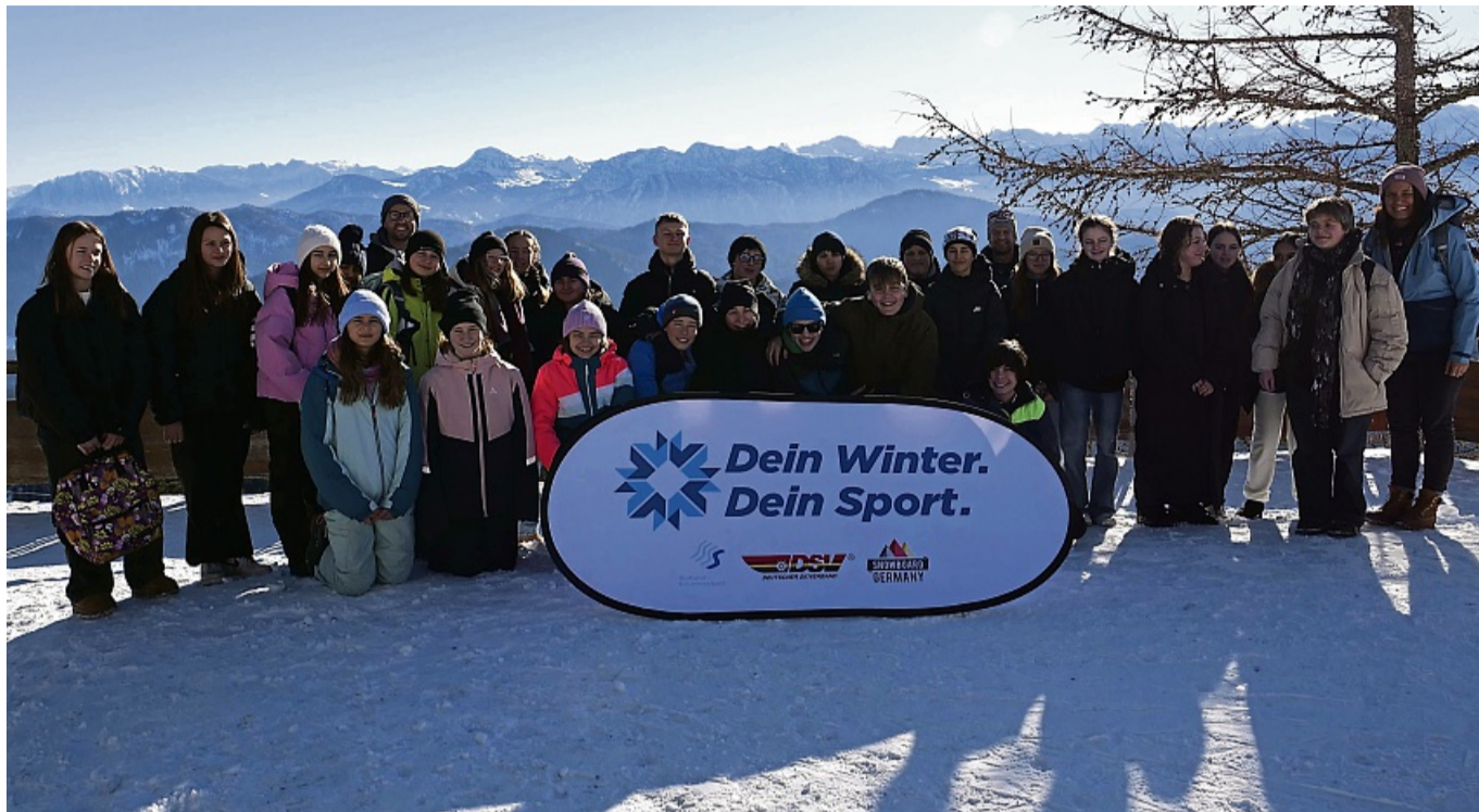
Erinnerungsfoto an der Bergstation der Brauneckbahn: Die 7. Klasse der Realschule Unterpfaffenhofen hatte eine erlebnisreiche Skiwoche in Lenggries. THOMAS AMMER

Die Anreise erfolgt klimafreundlich mit der Bahn. Alle Schülerinnen und Schüler werden bei Bedarf zudem mit Leih-ausrüstung von Intersport ausgestattet. Die Kosten für Anreise, Mobilität vor Ort, Liftpässe sowie die Übernachtung werden vollständig übernommen.