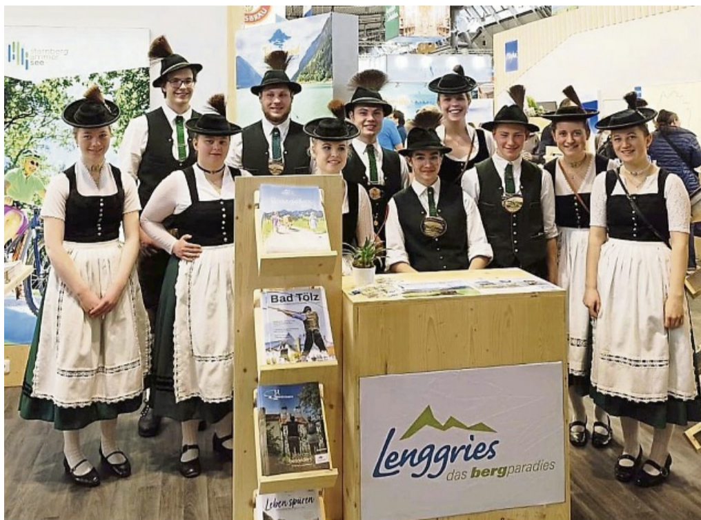
Die Aktiven des Lenggrieser Tachtenvereins Hirschbachtaler zeigten auf der Reisesmesse in Stuttgart ihr Können