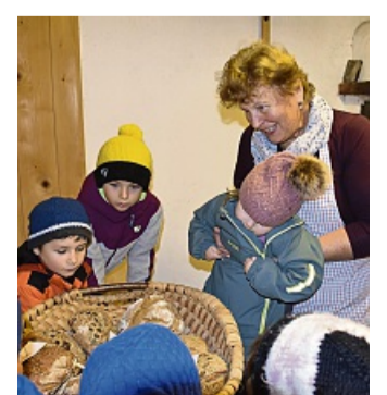
Kinder freuen sich über das frische Brot. LN

„Unsere Heimat“, so lautet das Jahresthema der Kindertageseinrichtung St. Antonius in Wegscheid. In dieser Zeit dürfen die Kinder unseren schönen Isarwinkel noch besser kennen und schätzen lernen. So entstand die Idee, den Kindern auch die Erfahrung zu vermitteln, wie denn früher und auch heute noch Brot gebacken wurde beziehungsweise wird. Frau Schalch konnte es uns anschaulich zeigen, und die Kinder durften kneten, Brotgewürze riechen und beobachten, wie in einem Holzofen gebacken wird. Natürlich wurde das Brot probiert - im Kindergarten