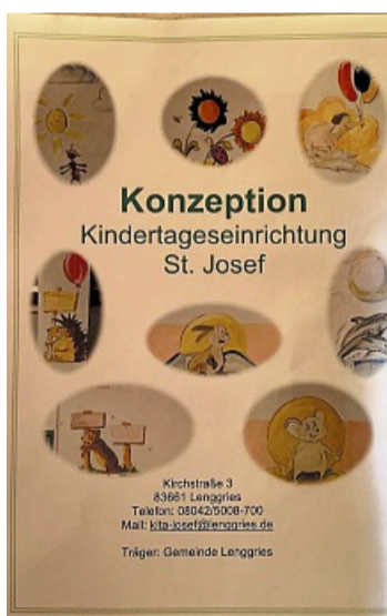
Die neue Konzeption der Kita St. Josef umfasst 30 Seiten.

vor allem an der Einrichtung interessierte Eltern und Kollegen aus Fachkreisen.