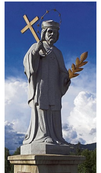
Der neue steinere Nepomuk steht seit 2007. REGINA MÜLLER

zessionstuch im Heimatmuseum neben den beiden anderen Flößern, beziehungsweise Brücken-Heiligen. Der heilige Nikolaus und der heilige Nepomuk sind die hölzernen Prozessionsfiguren, die noch heute bei den festlichen Kirchenumzügen die Nähe zur Flößerei und das Leben mit der Isar symbolisieren.