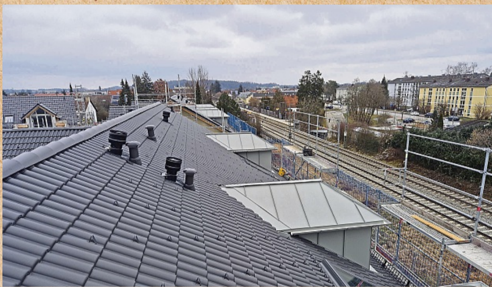
Große Dachflächen sind der Arbeitsbereich der Firma Reiser. REISER