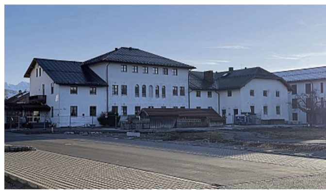
Das alte Krankenhaus soll abgerissen werden.

Der Abriss geschieht laut Bürgermeister Stefan Klaffenbacher nicht leichtfertig, sondern nach Plan. Die durch den Abbruch frei gewordene Fläche werde dringend für die Erweiterung für das Haus der Senioren gebraucht. Hier soll dann Raum für betreutes Wohnen entstehen, für das es schon jetzt sehr viele Interessenten