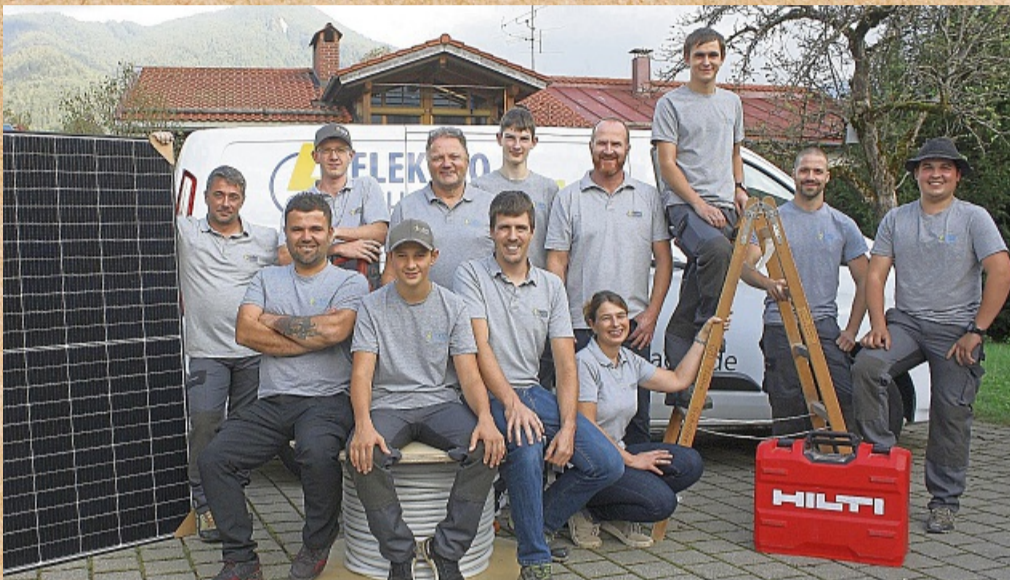
Die Belegschaft der Lenggrieser Firma Schader.