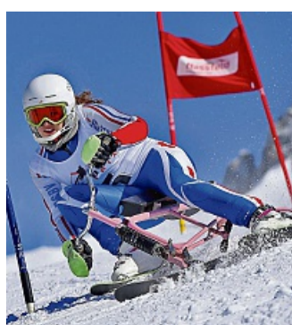
Flott unterwegs auf dem Skibob.