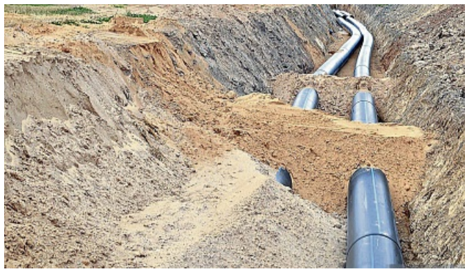
Eine Nahwärme-Leitung wird verlegt. STRUVICTORY

LN – Mit einem Nahwärmenetz heizen und ein eigenes Nahwärmenetz privat aufbauen: Wer dies anstrebt – ob mit Hackschnitzel, Holzpellets oder unterstützt mit Erdwärme oder Biogas – dem empfiehlt die Gemeinde Lenggries sich vor Projektbeginn unbedingt vorab bei der örtlichen Bauverwaltung zu informieren, was bei der Umsetzung rechtlich zu beachten ist.