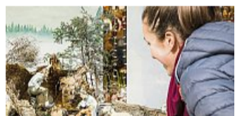
In Lenggrieser Schaufenstern sind in der Weihnachtszeit Krippen zu sehen. A. GREITER

Die Vorweihnachtszeit ist mit die schönste Jahreszeit im Isarwinkel. Gerne möchte die Tourist-Information Lenggries wieder in den Adventswochen einen Krippelweg in den Lenggrieser Schaufenstern organisieren. Beim „Kripperschaug'n“ sollen die Besucher durch den Ort geführt werden, ein wenig verweilen und den vorweihnachtlichen Einkaufsbummel mit allen Sinnen genießen. Der Krippelweg soll vom 1. Dezember 2024 bis einschließlich 6. Januar 2025 zu besichtigen sein. Haben Sie ein schönes Krippel, das Sie im Schaufenster Ihres Geschäftes aufstellen möchten? Dann melden Sie sich in der Tourist-Info, E-Mail: info@lenggries.de oder Telefon 0 80 42/50 08-800.