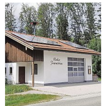
Das Feuerwehrhaus Winkl mit der PV-Anlage.