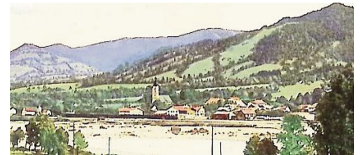
Der neue Bahnhof auf einer Ansichtskarte von 1924.