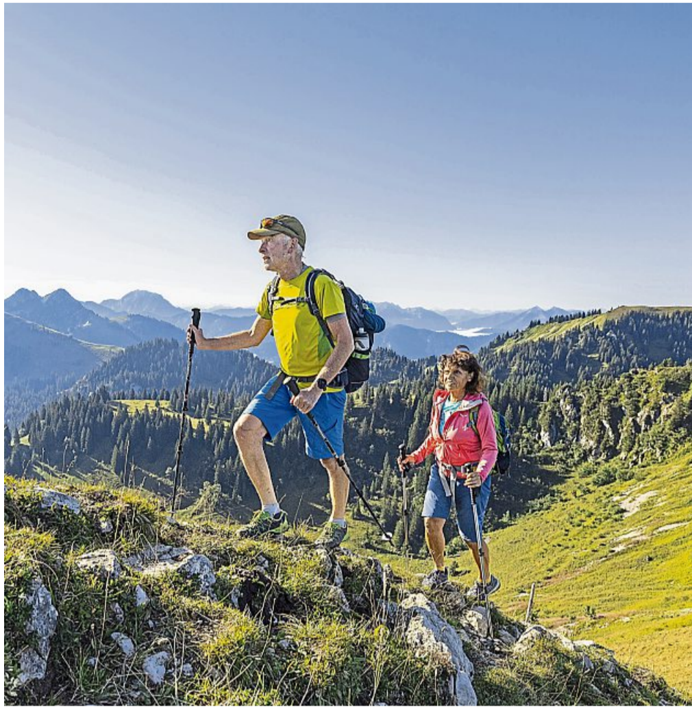
Unterwegs in den Isarwinkler Bergen: Ein Wander-Paar am Seekar.

Den Abschluss der ersten Woche bildet die Steinölbrennerei, die vom Achensee zur Tiroler Steinölbrennerei führt. Dort erwartet die Teilnehmer eine exklusive Führung durch die Steinölbrennerei. Diese Führung gibt einen tiefen Einblick in den faszinierenden Prozess der Steinölbrennerei.