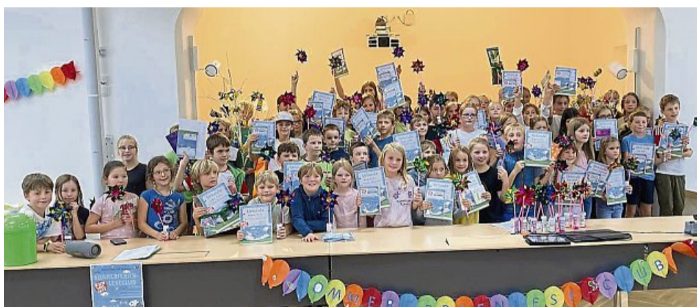
Gute Laune herrschte bei der Abschlussparty in der Gemeindebücherei Lenggries.