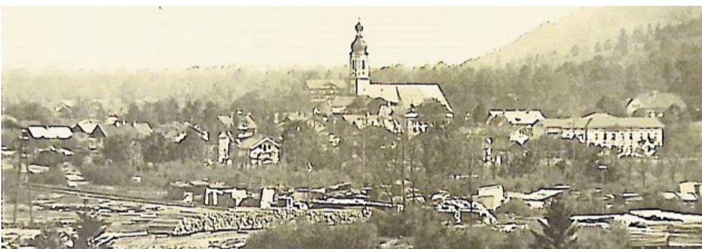
Das Holzganter am Lenggrieser Bahnhof in den 1930er-Jahren.