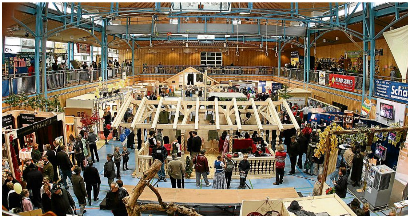
In der Lenggrieser Mehrzweckhalle gibt es bei der Gewerbebeschau viel zu sehen - so wie auf dem Archivfoto von 2013.

Die nächste Ausgabe der Lenggrieser Nachrichten erscheint bereits am Donnerstag, 24. Oktober. Redaktions- und Anzeigenabschluss ist deshalb schon am Donnerstag, 17. Oktober. Wir bitten um Beachtung.