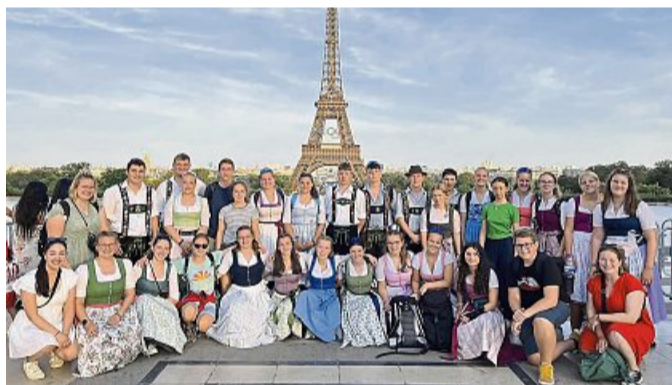
Erinnerungsfoto: Die Gruppe in Paris vor dem Eiffelturm mit den olympischen Ringen.

Der Austausch begann für die Lenggrieser aber schon vor der Bretagnefahrt: Anfang August kam die bretonische Gruppe für zwei Wochen in den Isarwinkel, wo sie bei allen Programmpunkten von Lenggrieser Jugendlichen begleitet wurde. Die geknüpften Freundschaften konnten dann in den zwei Wochen in der Bretagne vertieft werden, da auch die