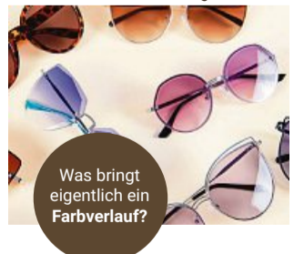
Was bringt eigentlich ein Farbverlauf?

Was bringt ein Farbverlauf in der Sonnenbrille? Sie werden den Unterschied sofort spüren, sobald Sie sie aufsetzen! Durch die getönten Gläser, die oben dunkler und nach unten hin heller sind, sind Ihre Augen optimal vor Blendung geschützt, während Sie in schattigeren Umgebungen wie im Wald oder im Geschäft stets klarsehen können. Besonders praktisch für Brillenträger, die ihre Brille aufgrund der Sehstärke nicht ständig abnehmen