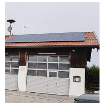
Das Gerätehaus der Feuerwehr Wegscheid.

Die Kosten für Material, etc. wurde von der Gemeinde Lenggries übernommen. Für die gute Unterstützung der Feuer-