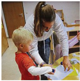
Eine Erzieherin arbeitet mit einem Kindergarten-Kind. LN

Es gibt wohl kaum einen abwechslungsreicheren und zukunftsbedeutenden Beruf als den des Erziehers. Nicht umsonst gibt es so viele Umschreibungen, die direkt im Zusammenhang des Berufsbildes stehen: Tränentrocknerin, Geschichtenvorleserin, Streitschlichter, Helfer mit Herz, Berater, Eltern-Coach, Ideensammler und auch Spielkamerad. Deshalb freuen wir uns um so mehr, wenn junge Menschen diesen tollen Beruf erlernen und eine Ausbildung beginnen.