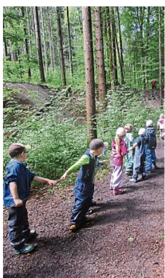
Hand in Hand geht es durch den Wald.