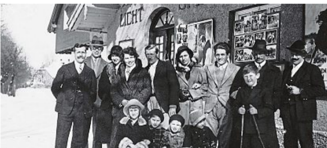
Das alte Lichtspielhaus am Lindenweg wurde Mitte der 1940er-Jahre erbaut.