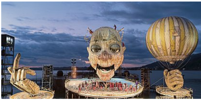
Mit „Rigoletto“ (hier die Inszenierung in Bregenz) begann die Besuchsreihe der Theatergemeinde.