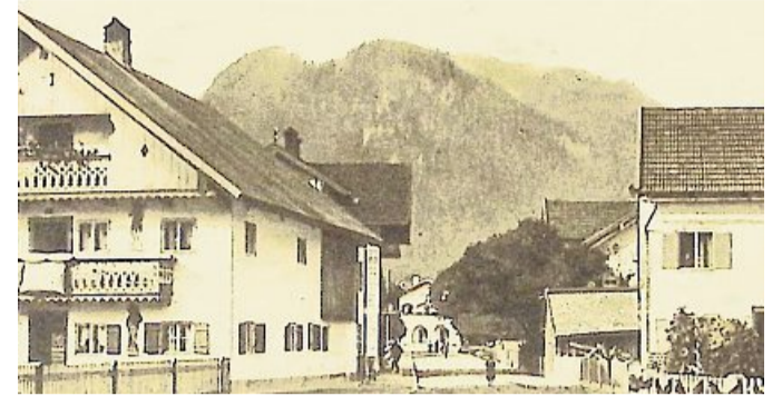
Girlandenschmuck in der Bahnhofstraße.

Am Ende der Strecke in Lenggries wurde ein umfangreiches Bahnareal angelegt, da nicht nur der Ausflugsverkehr in den