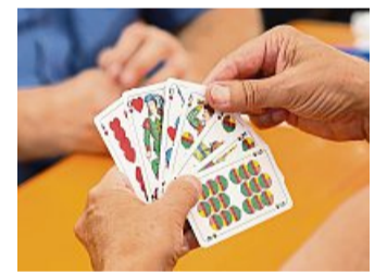
Gute Karten sind beim Schafkopfen gefragt.