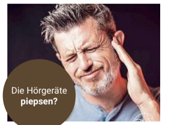
Die Hörgeräte piepsen?

das die Ohren bzw. die Gehörgänge verstopft sind. Ein Blick in ihre Ohren schafft Klarheit.