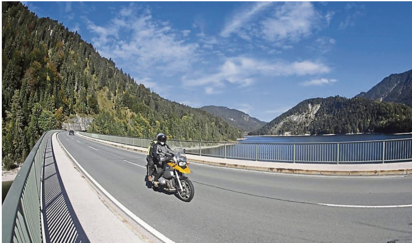
Unfallschwerpunkt: Der Sylvensteindamm ist zum Treffpunkt der Motorradfahrer geworden.

Erfreulicherweise haben auch Landratsamt und Polizei zügig Schritte eingeleitet, diese Entwicklung zu unterbinden und die Verkehrssicherheit zu verbessern. Seit dem 21. August