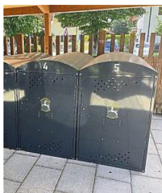
Radlboxen für E-Bikes gibt es neuerdings am Lenggrieser Bahnhof.

Sollte sich dieses Modellprojekt bewähren und vernünftig genutzt werden, kann eine Erweiterung dieses Projektes sicherlich angedacht und geplant werden.