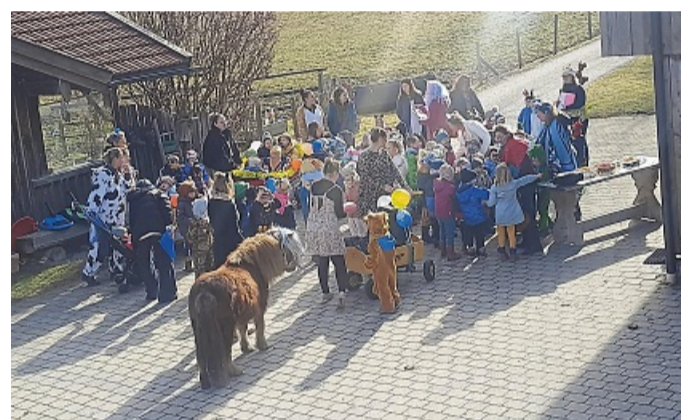
Beim Faschingszug der Kinder in Wegscheid war auch ein als Einhorn verkleidetes Pony mit dabei. LN