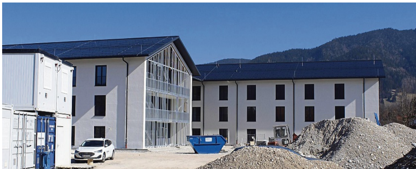
Großbaustelle auf der Zielgeraden: Die beiden Blöcke des neuen Lenggrieser Pflegeheims.