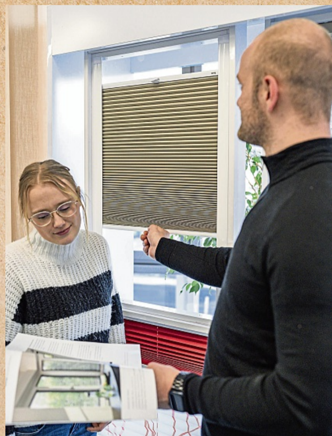
Gut beraten: Klimaschutz, Sicherheit und Wohnkomfort: Sonnenschutzsysteme bieten viele Vorteile. Rund um den R+S-Tag 2025 erklären Experten, wie smarte Steuerungen und moderne Rollläden das Zuhause effizienter und sicherer machen. BUNDESVERBAND ROLLADEN + SONNENSCHUTZ E.V. (BVRS)

Ein weiterer Vorteil ist die Sicherheit: Einbruchhemmende Rollläden erschweren es potenziellen Tätern, ins Haus einzu-