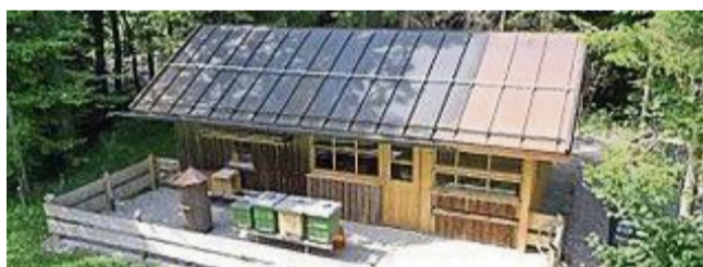
Der Lehrbienenstand der Lenggrieser Imker.

Die Land- und Forstwirte im Gemeindebereich Lenggries werden gebeten, ihren Bedarf an Forstpflanzen für die Frühjahrskultur 2025 bis 31. März in der Gemeindeverwaltung Lenggries zu melden. Die Bestellung kann persönlich im Rathaus, telefonisch unter der Nummer 08042/5008160, schriftlich oder per E-Mail an f.demmel@lenggries.de vorgenommen werden.