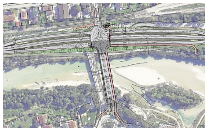
Der Verkehrsknotenpunkt auf der Brücke (links daneben die bestehende) soll künftig mit Abbiegespuren und Ampeln gelöst werden. Auf- und Abfahren soll möglich sein, ohne die Gegenspur queren zu müssen.

Favorit bei den Planungen ist seitens des Bauamtes eine Variante mit Abbiegespuren und Ampeln, damit der Verkehr auf den Straßen, die sich auf der Brücke kreuzen, fließen kann. Vorgesehen sind Auf- und Abfahrtsrampen der B13. Der Vorteil: Die B13 muss bei der Einfahrt nach Lenggries nicht mehr gekreuzt werden, was erheblich sicherer ist. Auch Radfahrer und Fußgänger sind in diese Planungen mit eingebunden.