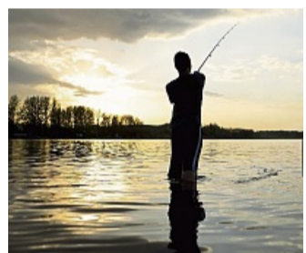
Ein Fischer im Abendrot.

LN – Seit dem 1. Januar 2025 können Minderjährige ab Vollendung des 7. (statt bisher 10.) Lebensjahres ohne Fischereischein mit einer Begleitperson angeln gehen. Für die Kinder und Jugendlichen wird kein Fischereischein mehr benötigt. Die Begleitperson, die die Aufsicht hat, muss allerdings Inhaberin eines Fischereischeins sein.