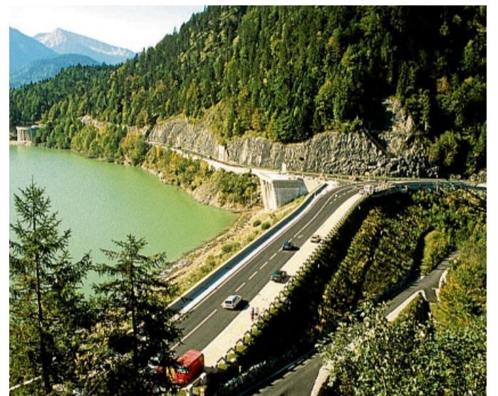
Der Sylvenstein-Staudamm wird verstärkt: Die Kronenmauer erhält einen Wellenabweiser. WASSERWIRTSCHAFTSAMT

rungspunkte für den mobilen Hochwasserschutz eingebaut. Das geschieht an den Felswänden in Richtung Fall und Kaiserwacht. Im Falle eines Hochwassers würden diese dafür sorgen, dass das Wasser vom Damm weg wieder zum See geleitet wird. Diese Betonvorsatzschalen werden voraussichtlich im November montiert. Für die ein- bis zweiwöchige Bauzeit sind jeweils wieder einseitige Straßensperrungen not-