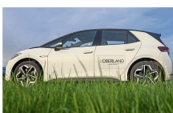
Dieses Elektroauto steht zum Verleih.

Es gibt über 40 weitere Standorte in den Landkreisen Bad Tölz-Wolfratshausen, Garmisch-Partenkirchen und Weilheim-Schongau. Sie sind rund um die Uhr verfügbar. Getankt mit 100 Prozent Ökostrom aus regionaler Wasser- und Sonnenenergie, tragen die Fahrzeuge aktiv zum Umweltschutz bei – direkt vor der Haustür.