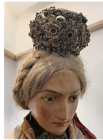
Im Heimatmuseum steht bereits diese Figur.

Ähnlich wie der Brautgürtel wurde auch die Brautkrone als das wertvollste Kleidungsstück der Braut bei der Hochzeit angesehen. Für nicht so wohlhabenden Familien, die sich kei-