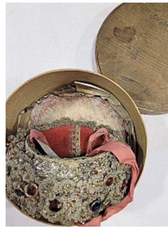
Geschützt in einer Spanschachtel: Die Brautkrone.

Die neue Lenggrieser Brautkrone ist mit roten aber auch mit den seltenen blauen zentralen Glassteinen geschmückt. Eine Symbolik der Farben rot und blau für die Hochzeit ist nicht von der Hand zu weisen. Rot steht sinngemäß für die Liebe und Blau für die Treue. Manchmal sind die großen farbigen Glassteine mit goldenen Motiven hinterlegt, die in erster Linie mit einem religiösen Thema in Verbindung stehen, wie das Herz der Anker oder das Kreuz – für Liebe, Hoff-