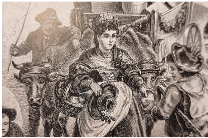
Die Brautkrone war früher gängiger Kopfschmuck. Hier eine Grafik aus der „Illustrierten Chronik der Zeit“ von 1886. LN

Im Vergleich mit der Krone im Heimatmuseum, die ins 19. Jahrhundert datiert, wird deutlich, dass die neue Brautkrone etwas später zeitlich anzusetzen ist. Dass dieser Kopfputz noch in der 2. Hälfte des 19. Jahrhunderts gängig war, zeigt eine Grafik aus „Illustrierte Chronik der Zeit“ von 1886, die die Braut mit Brautkrone zeigt, auf